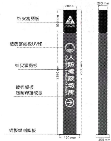
人防掩蔽场所标识牌图样

1、紧急掩蔽示意图，规格：高 2400mm × 宽 2400mm × 厚 300mm（依据实际安装情况进行调整），设置于小区（大厦）行人主要出入口的显著位置；